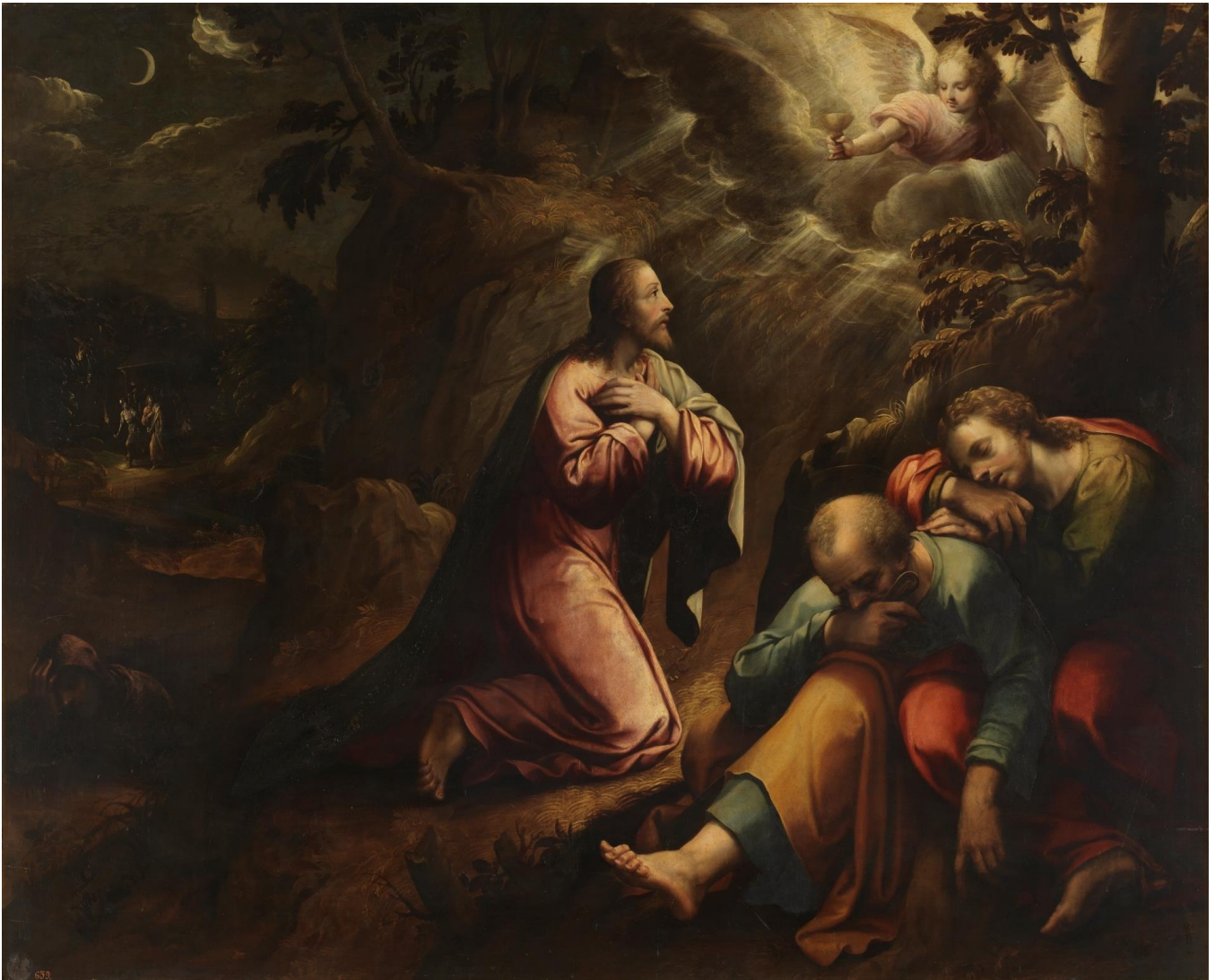
Giorgio Vasari. La oración en el Huerto. Museo del Prado. 1630

Nos pasa a todos muchas veces. No sabemos o no somos capaces de estar cerca del hermano o del amigo que nos necesita. Nos pide una palabra, un gesto, una presencia comprensiva y solidaria, pero nosotros dormimos, vamos a lo nuestro.