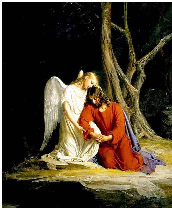
Carl Bloch. Un ángel consolando a Jesús antes de su arresto en Getsemaní. Museo de Historia Nacional. Copenhague.

SILENCIO ORANTE: Jules Massenet. Thaïs. Acto II Méditation