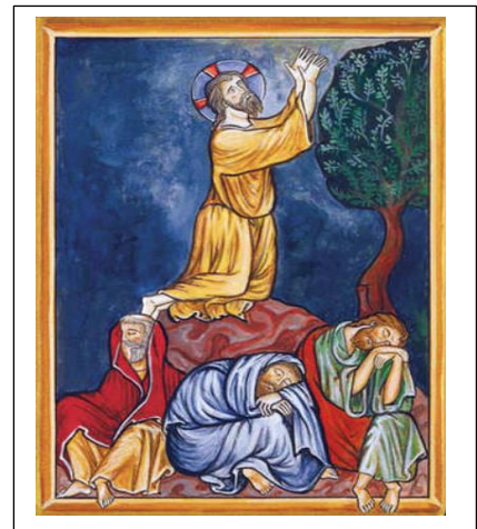
Agonía de Jesús en el huerto de los Olivos. Icono contemporáneo según el Salterio de Ingeburge, S. XII.

[SILENCIO ORANTE]: Pergolesi. Stabat Mater