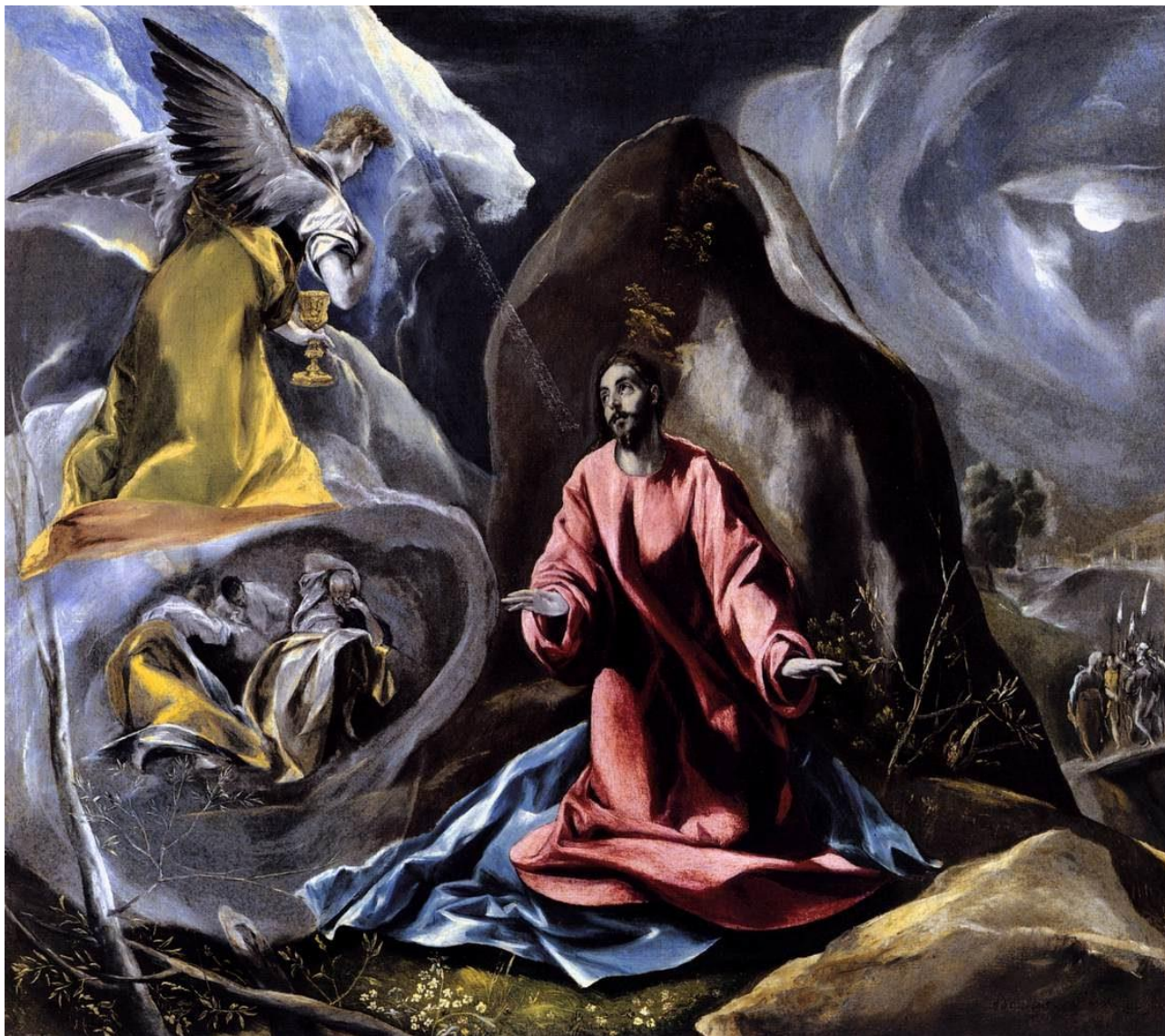
El Greco. Oración en el huerto . Iglesia de Santa María la Mayor de Andújar, Jaén. 1607

[Mozart. Adagio para violín y orquesta . K 261]