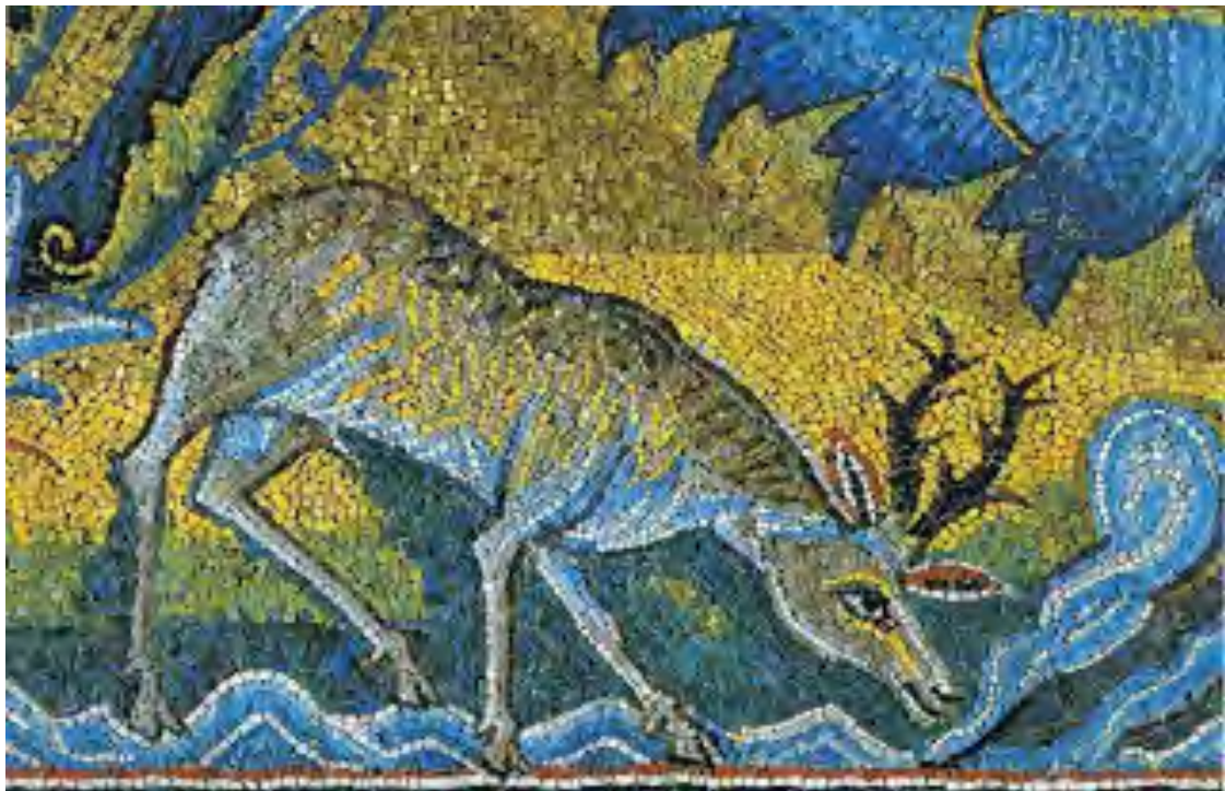
El ciervo. Mosaico Apse, Basilica de San Clemente, Roma.

[CORO B] Se me rompen los huesos por las burlas del adversario; todo el día me preguntan: «¿Dónde está tu Dios? »