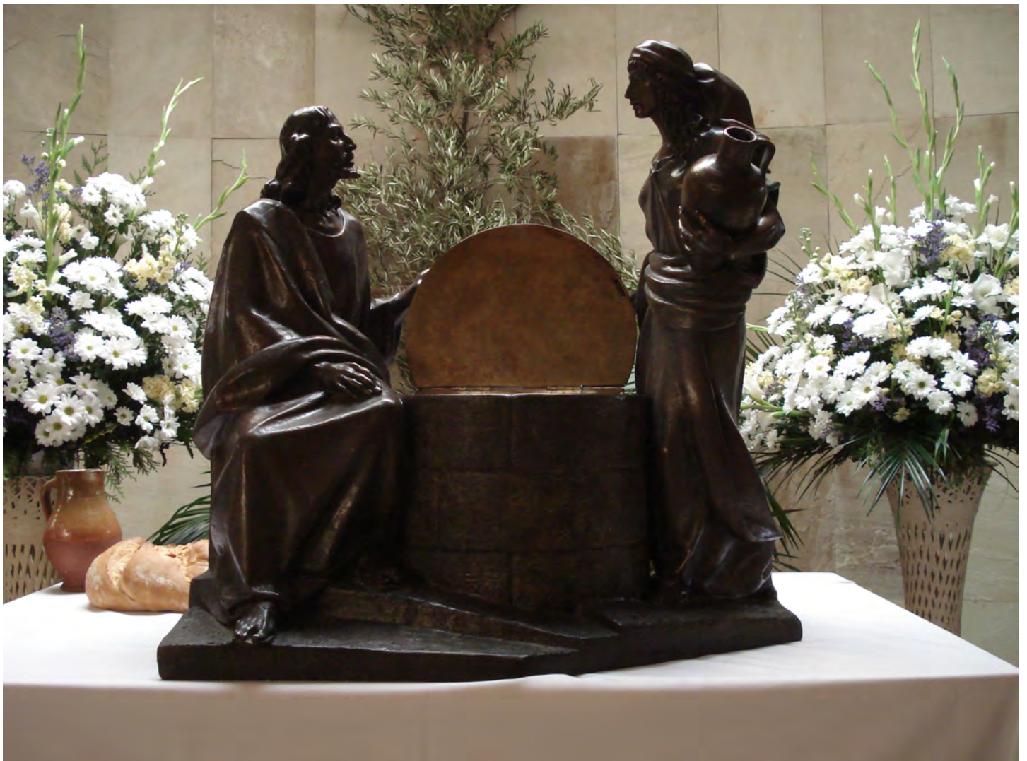
Sagrario de Santa María Madre de Dios