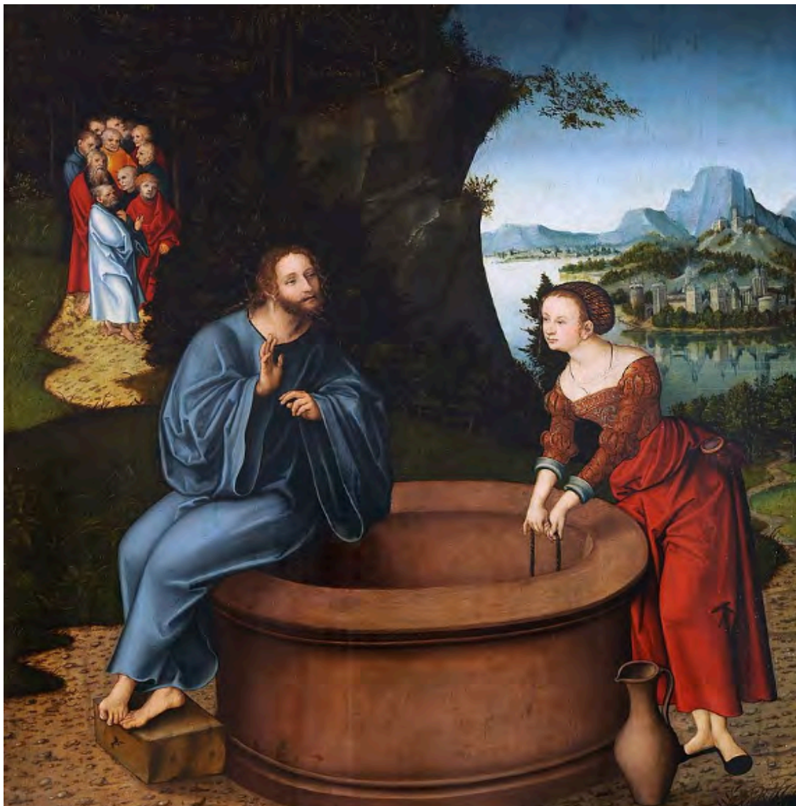
Lucas Cranach el Viejo. Cristo y la mujer samaritana. Museum der bildenden Künste Leipzig. 1537

La samaritana acude al pozo. El pozo siempre había sido un don del Señor. El agua en medio del desierto era el don máspreciado y a su alrededor bullía la vida de los pueblos y se forjaban las alianzas.