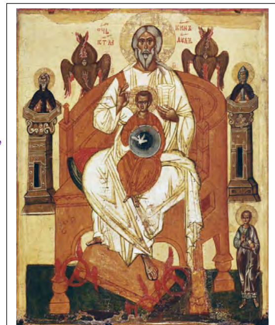
Icono de Novgorod. El Padre. Rusia. S. XV