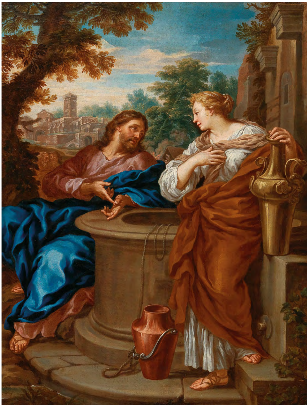
Ciro Ferri. Jesús y la mujer samaritana en el pozo . 1630. Roma. Colección privada

“¿Cuál es nuestro cántaro interior que nos aleja de Dios?”